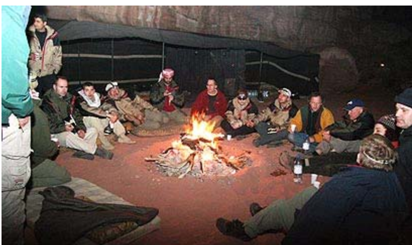
משתתפי המסע מתכוננים בירדן

המסע מתוכנן כך שכל אחד מהמשתתפים יהיה זקוק לסיוע של משתתפים אחרים, חלקם ממדינות אויב, ויחד יאלצו להתמודד מספר שבועות עם איתני הטבע. גם המשתתפים וגם המארגנים יודעים שיהיה קשה מאוד למנף אירוע תקשורת ליוזמת שלום של ממש, ומודים בחצי פה שהמטרה היא לייצר הד תקשורת, אך הם מקווים שהמסע יסייע ליצור אמון ואולי ישרה מעט אווירה של דו-שיח בין מדינות המערב למדינות מוסלמיות.