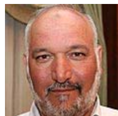
שיח טהא. לדבר עם הסבל